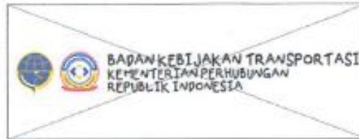
Mengubah jenis huruf logo