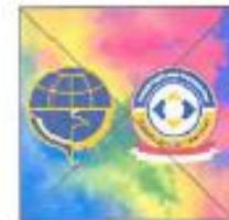
Menggunakan latar belakang yang berwarna warni