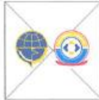
Mengubah komposisi warna Logo