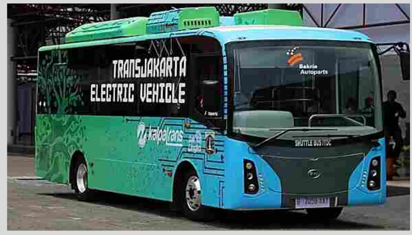
Medium Bus 7 meter Merk : BYD Tipe C6 Dimensi : 7 meter x 2,1 meter x 3 meter