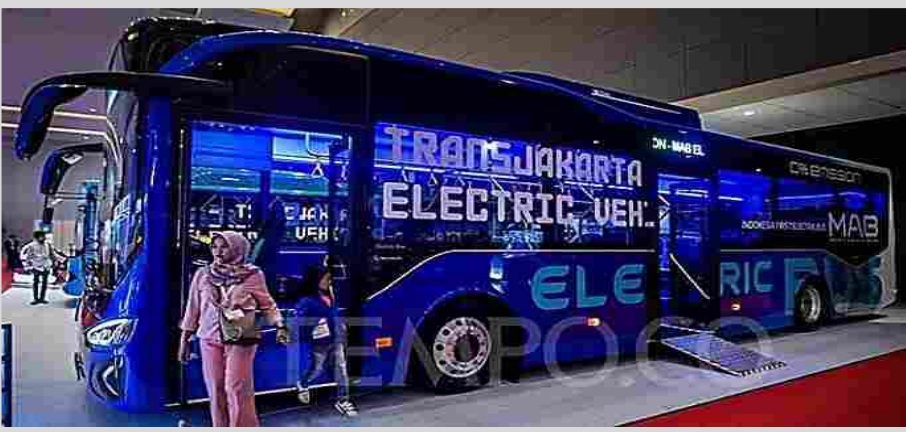
Single Bus 12 meter Merk : MAB Tipe MD12E Dimensi : 12 meter x 2,5 meter x 3,4 meter