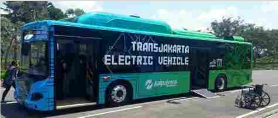
Single Bus 12 meter Merk : BYD Tipe K9 Dimensi : 12 meter x 2,5 meter x 3,4 meter